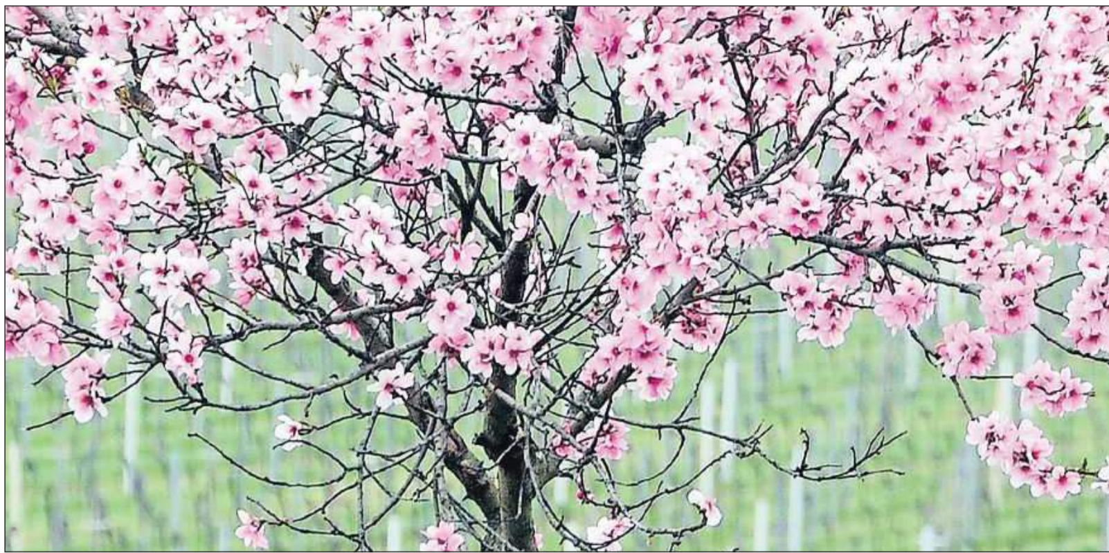
Die Mandelblüte an der Deutschen Weinstraße lässt dieses Jahr auf sich warten. Es gibt noch keinen Termin für das Blütenfest im Weinort Gimmeldingen, durch den unsere Tour führt.