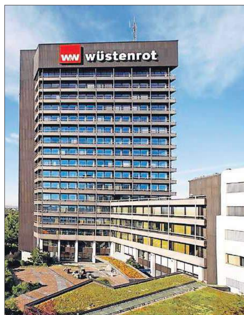
Der W&W-Konzern will mehr als 10 Prozent der Arbeitsplätze im Inland abbauen. Unser Bild zeigt den Standort Ludwigsburg.

In der Baufinanzierung will Wüstenrot ihren Kunden künftig auch Kredite von Hunderten anderer Anbieter vermitteln, über das gleiche Online-Portal des Finanzvermittlers Interhyp, das die Commerzbank seit 2012 nutzt. Die zweitgrößte deutsche Bausparkasse hinter Schwäbisch Hall wolle sich mittelfristig als „Spezialist für Bausparen und handliche Finanzierungsbausteine“ positionieren, teilte W&W mit. 2012 hatte ihr abgeschlossenes Neugeschäft bei 15,3 Milliarden Euro stagniert.